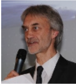
Iris Neitmann | Jörn Walter © BSU Hamburg | Volker Roscher © BDA Hamburg