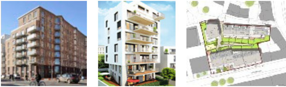
Sandtorpark © HafenCity Hamburg GmbH | Arnoldstraße © Wernst Immobilien, Lageplan © LRW Architekten

Besichtigung von aktuellen Wohnbauprojekten mit Führung durch Architekten/innen bzw. Bauherren. Die Vorstellung der Projekte erfolgt im Handout zur Exkursion. Änderungen im Ablauf der Exkursion und bei der Auswahl der Projekte sind vorbehalten.