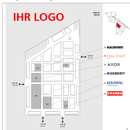
Beispiel Hallenplan Broschüre 2018

In der Programmbroschüre werden erneut die GET Nord Hallenpläne abgedruckt, um den Architekten die Orientierung auf der Messe zu erleichtern . Auf diesen werden ausschließlich beauftragte Logos abgebildet. (Die Pläne enthalten kein vollständiges Ausstellerverzeichnis).